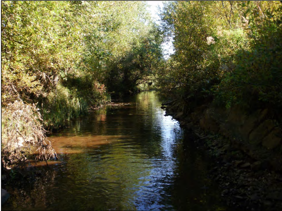
Järviojan vähävetistä, hidasvirtaista ja suvantomaista koealaa.