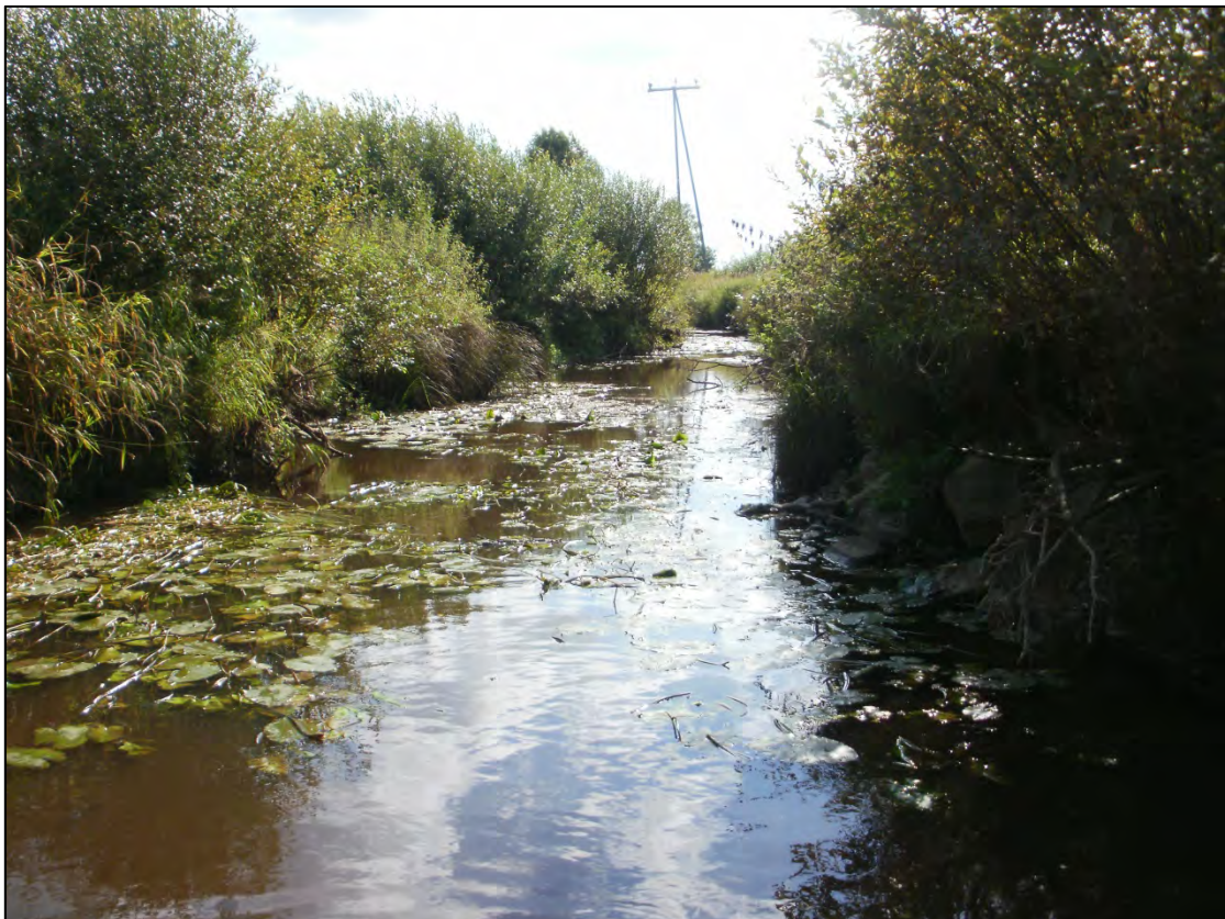
Mertuanojan osin louhikkoista ja runsaskasvustoista koealaa. Koealalta saatiin mm. yksittäinen kuhanpoikanen.