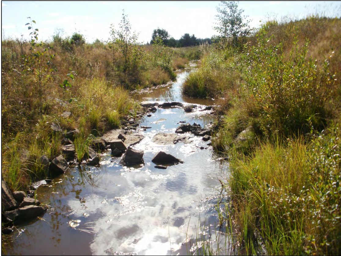
Suorsanojan viljelysmaiden keskellä virtaavaa vähävetistä ja kapeaa koealaa. Koealalta saatiin mm. suurehkoja haukia ja säyneitä.